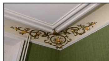
Moultures de l'ancienne salle du conseil, 2016