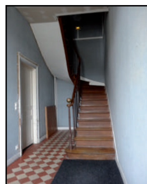
Escalier de l'ancien logement de l'instituteur, 2016