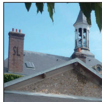
Initiales « SL » et campanile de la mairie-école, 2016

Aujourd'hui , le bâtiment est resté inchangé dans son architecture. A l'intérieur, seule la salle du conseil a été transformée en deux bureaux. A l'extérieur, certaines souches de cheminées ont disparu. Côté cour, elles ont été préservées avec leurs ancrs métalliques formant les initiales de la commune « SL ». La qualité architecturale, les dimensions du bâtiment et du clocher, de type plus urbain que rural, témoignent de l'aisance de la municipalité de l'époque. En cela, la mairie-école constitue un édifice majeur servant de repère dans le paysage communal, et demeure l'une des mieux préservées et des plus monumentales à l'échelle du Parc. Il s'agit de l'un des rares lieux à avoir maintenu la double fonction de l'édifice.