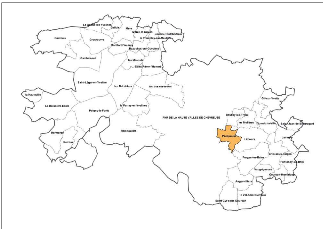
Localisation de Pecqueuse par rapport au PNR et aux autres communes favorables à leur rattachement – Kargo 2008