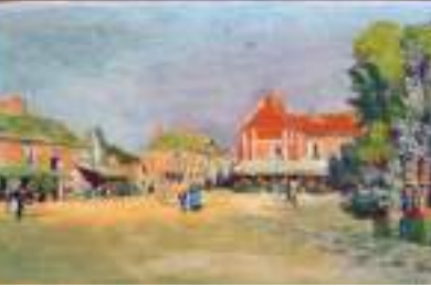
Edouard LEVERD, La place de Cernay, huile sur panneau, collection de la mairie de Cernay-la-Ville.