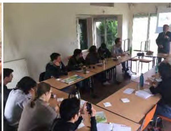
Présentation par Monsieur Berrichello de la politique de la CCPL autour de la mobilité