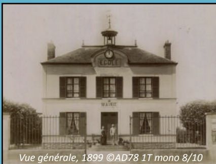
Vue générale, 1899

Architecte : Phileas Boisne Date de construction : 1881 Adresse : 6 rue de l'Hirondelle Fonction actuelle : mairie