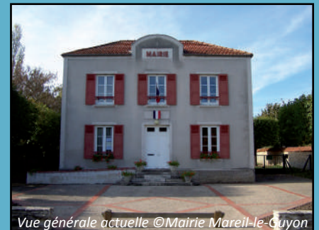
Vue générale actuelle