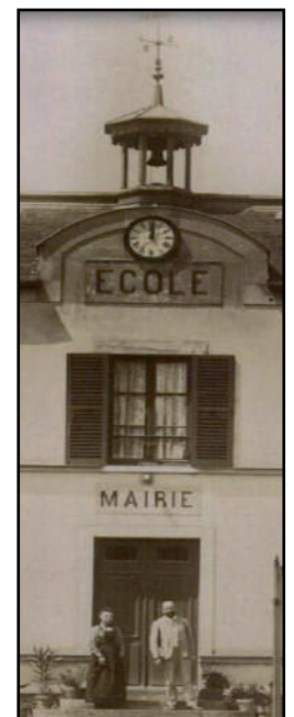
Entrée de la mairie-école, 1899 ©AD78 1T mono 8/10

La mairie-école est un bâtiment simple en pavillon avec un toit à quatre pans en ardoise surmonté d'un campanile, qui présente un plan en T. Elle est construite en pierre meulière recouverte d'un enduit réhaussé par des éléments de décor qui marquent les niveaux et les angles. La façade principale, de composition symétrique et ternaire, est couronnée d'un fronton portant à l'origine l'inscription « ECOLE ». Son pendant « MAIRIE » prenait place au-dessus du perron de l'entrée. A l'intérieur, les pièces se répartissent autour d'un vestibule central. Au rez-de-chaussée se trouvent la mairie à droite et les pièces à vivre (cuisine et salle à manger) à gauche, tandis que la salle de classe se trouve dans le prolongement de l'entrée. A l'étage, l'instituteur et sa famille disposent de quatre chambres. L'espace extérieur de l'école mixte est pourtant distinct selon les sexes : garçons et filles ont leur propre entrée de part et d'autre du portail, préau et cour de récréation. Enfin, deux corps de bâtiments situés aux extrémité de la grille de clôture servent de buanderie et de pompe à incendie. L'instituteur, qui remplit alors aussi les fonctions de secrétaire de mairie, possède un grand jardin à l'arrière de l'école, une basse-cour pour ses poules, un clapier pour ses lapins et un bûcher pour stocker son bois de chauffage.