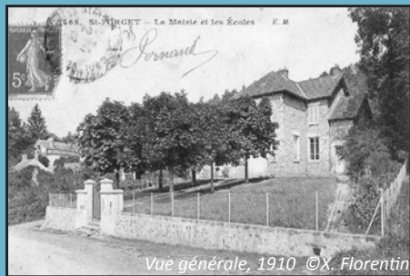
Vue générale, 1910