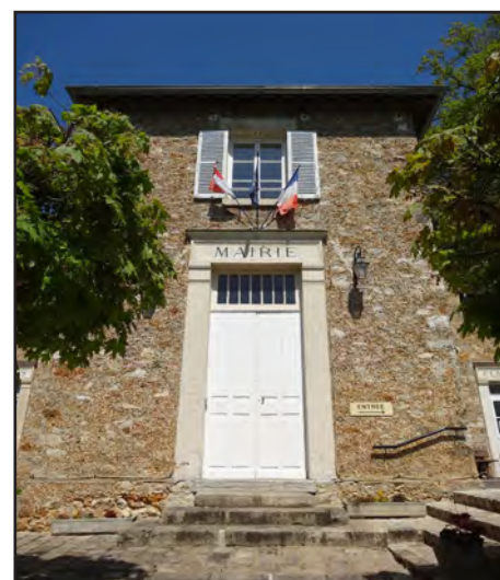
Façade entrée mairie, 2016

Aujourd'hui , le bâtiment est resté inchangé à l'extérieur et dans la disposition des espaces intérieurs, hormis la salle de classe cloisonnée en accueil. La salle de mairie est devenue la salle du conseil, le logement de l'instituteur sert toujours d'habitation, et la cour de récréation à l'arrière est toujours là, avec son préau ouvert à charpente en bois et ses latrines !