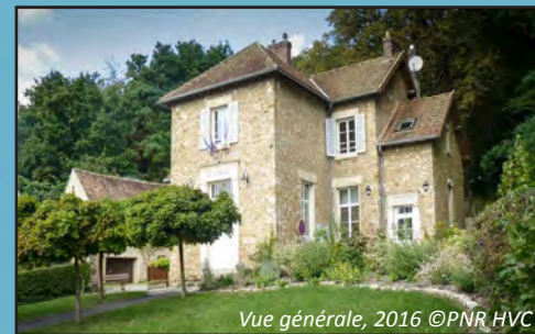
Vue générale, 2016

Architecte : Albert Petit Date de construction : 1884 Adresse : 16 rue de la Mairie Fonction actuelle : mairie