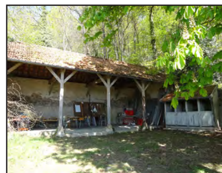
Préau et latrines, 2016