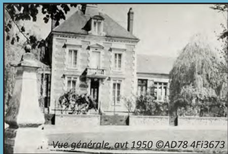
Vue générale, avt 1950 ©AD78 4Fi3673