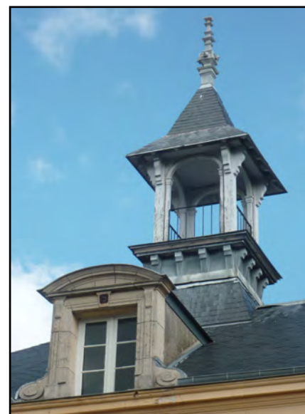
Campanile, 2012

« La municipalité actuelle porte le plus grand intérêt à l'instruction ; [...] elle est prête à faire les plus grands sacrifices pour améliorer de plus en plus la situation et le bien-être des enfants. »