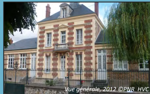
Vue générale, 2012