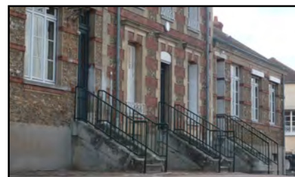
Rampes d'escaliers, 2012

Aujourd'hui , le bâtiment est resté inchangé à l'extérieur comme à l'intérieur où beaucoup d'éléments ont été préservés. La disposition des différents espaces est la même, à quelques cloisons près. Les sols en parquet ou tomettes, les foyers de cheminée et certaines pièces du mobilier dont des placards à instruments de mesure et de vieilles tables d'écoliers sont encore en place. La mairie est devenue salle de classe, une partie du logement de l'instituteur a été transformée en une troisième classe, tandis que l'étage sert d'espace de stockage.