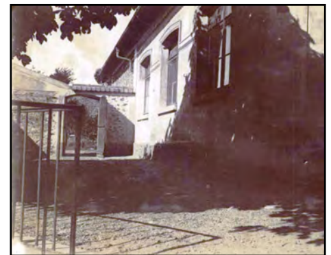
Cour de l'école des filles, 1899 ©AD78 1T mono 6/10

« L'instruction a fait de grands progrès depuis surtout que l'enseignement primaire est gratuit et obligatoire. Cependant, il est regrettable que [...] bon nombre d'enfants ne fréquentent pas encore régulièrement l'école, ils sont trop souvent retenus à la maison par leurs parents qui les emploient aux travaux de la campagne. »