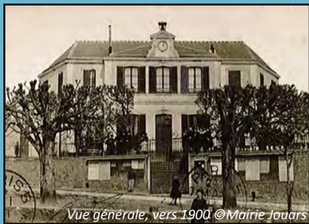
Vue générale, vers 1900