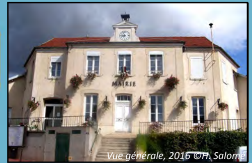
Vue générale, 2016