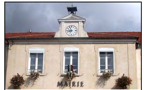
Horloge à fronton et cloche, 2016

Aujourd'hui , l'édifice est resté inchangé et a conservé son architecture atypique à l'allure de proue républicaine dont les dimensions et la position imposantes en font un véritable symbole de la commune. Depuis 2015, il accueille une école de musique.