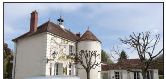
Arrière mairie, 2016

L'ancienne mairie-école est bâtie en pierre de meulière enduite. Elle présente une composition de façade régulière et symétrique à quatre travées. Plusieurs éléments la distinguent des autres maisons du bourg. Précédée par un perron, elle est décorée d'éléments en plâtre imitant la pierre de taille et possède un couronnement typique des mairies-école : l'horloge surmontée d'un fronton portant l'inscription « MAIRIE » et le clocheton. La tourelle à toit conique que l'on aperçoit à l'arrière du bâtiment abrite l'escalier desservant les pièces à l'étage.