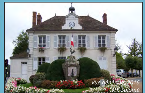
Vue générale, 2016