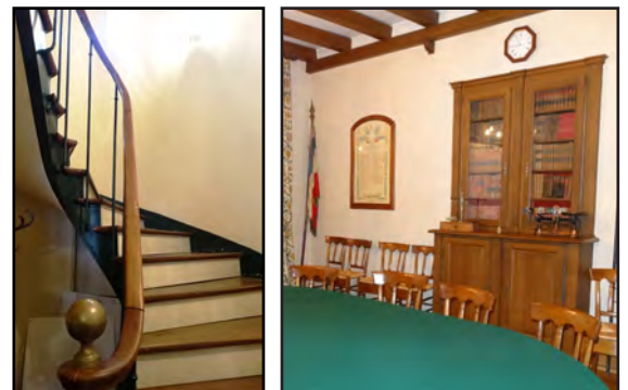
Escalier et salle du conseil, 2016

Aujourd'hui , le bâtiment est resté inchangé, la disposition des espaces intérieurs également. On y trouve notamment la porte de l'ancienne salle à manger de l'instituteur en entrant sur la gauche et le vieil escalier en vis. Seul changement, la salle du conseil s'est installée dans l'ancienne salle de classe suite à l'externalisation de l'école. A l'étage, bureau du maire et salle des archives occupent désormais le logement de l'instituteur, et l'ancienne salle de mairie est devenue une salle de réunion qui conserve de vieilles étagères murales ainsi que la bibliothèque de l'école.