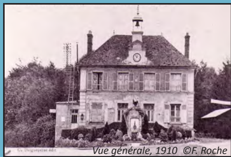
Vue générale, 1910