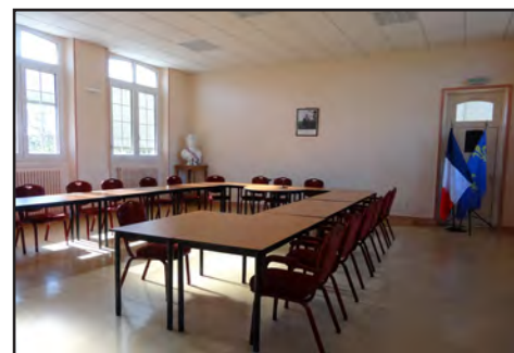
Salle du conseil, 2016

« [Dans l'ancienne école dans le presbytère], lorsque les jours sont courts et le temps brumeux, les élèves sont parfois dans l'impossibilité de transcrire un devoir au tableau noir ou de suivre la leçon sur une carte. »