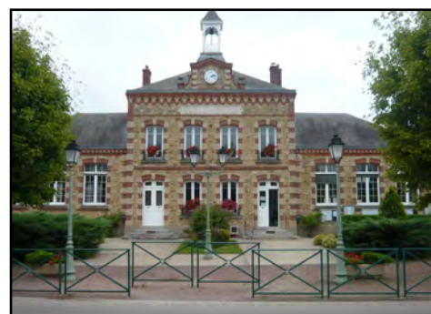
Façade, 2016

Aujourd'hui , seule la fonction des pièces a été modifiée. Le bâtiment est resté inchangé et a conservé son architecture remarquable, l'une des plus raffinées des mairies-écoles à l'échelle du Parc. Malgré la modestie de la commune à l'époque de la construction (environ 330 habitants), la qualité architecturale, les dimensions monumentales du bâtiment et du clocher témoignent de l'aisance de la municipalité et font de la mairie-école un véritable monument repère dans la commune.