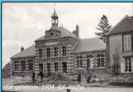
Vue générale, 1904