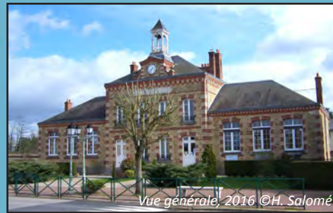
Vue générale, 2016