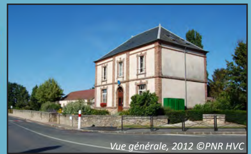
Vue générale, 2012