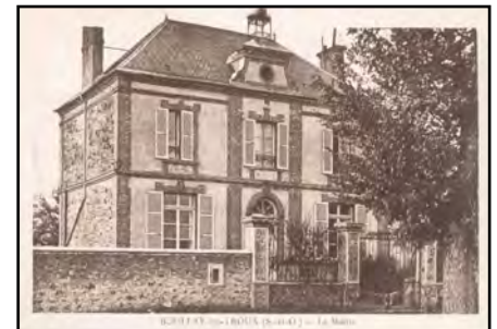
Façade, vers 1900

Aujourd'hui , le bâtiment reste inchangé à l'extérieur malgré la disparition du portail sur rue, du clocheton qui couronnait la façade et des souches de cheminée. A l'intérieur, la classe a été scindée en deux pour former le secrétariat et le bureau du maire. A l'étage, il existe encore un logement et un bureau accessible par l'ancien escalier.