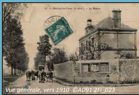
Vue générale, vers 1910 ©AD91 2Fi_023