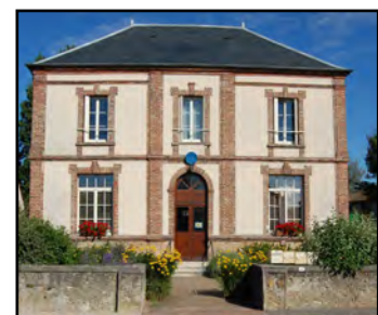
Façade, 2016