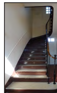
Escalier menant à l'étage, 2016

« La salle de classe [...] située au dessus de la cave est bien éclairée et est parquetée en chêne ; les murs sont peints à l'huile [...]. Toutefois ce qui fait défaut [...], ce sont les vasistas. [...] Les cours d'adultes sont fréquentés assidûment et les adultes des deux sexes suivent très régulièrement les conférences populaires. »