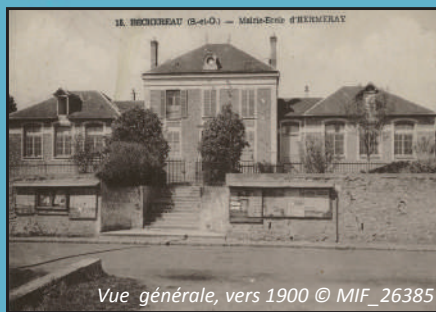
Vue générale, vers 1900