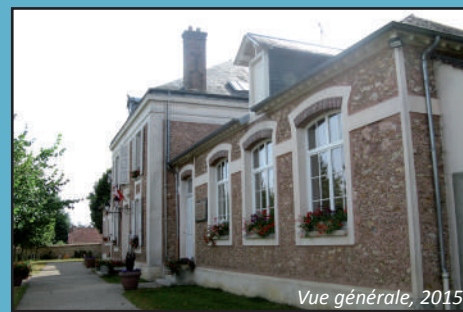
Vue générale, 2015

Architecte : Inconnu Date de construction : 1888 Adresse : 4 rue de la Mairie Fonction actuelle : mairie