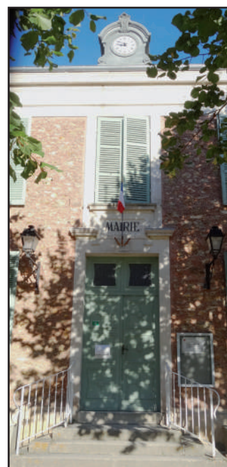
Entrée de la mairie, 2016

La mairie-école d'Hermeray présente une composition symétrique et ternaire organisée autour d'un pavillon central (la mairie et deux logements de fonction) et deux ailes basses (les écoles de garçons et de filles). Elle est bâtie en pierre de meulière et de calcaire couverte d'un enduit rocaillé. Le rocaillage est un revêtement décoratif constitué de fragments de meulière incrustés dans l'enduit qui peut être, comme ici, teinté. Le décor est complété par un enduit clair (bandeau et encadrements d'ouvertures) et par la brique des arcs surbaissés des ailes latérales. Ces détails, ainsi que les toitures à quatre pans en ardoise, les lucarnes et la position en hauteur avec perron contribuent à donner à la mairie-école une allure de maison de notable, destinée à ennoblir la jeune institution républicaine. Au-dessus de la porte principale est inscrite la mention « MAIRIE » qui, avec le porte drapeau, rappelle l'une des fonctions de l'édifice dont la Monographie communale (1899) nous présente la distribution d'origine. Le pavillon central s'organise de façon symétrique autour d'un vestibule d'entrée. A droite, se trouve le cabinet du maire, à gauche, la salle du conseil, en face, les salles à manger et cuisines de l'institutrice et de l'instituteur. Ces espaces privés communiquent avec les écoles de filles et de garçons, respectivement situées dans les ailes droite et gauche. Enfin, à l'étage, se trouvent les chambres des logements de l'instituteur et de l'institutrice.