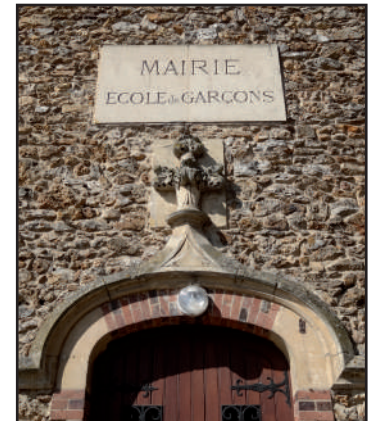
Décor de l'ancienne porte d'entrée, 2016

Aujourd'hui , l'édifice reste inchangé à l'intérieur comme à l'extérieur, si l'on exclut les extensions récentes. La disposition des pièces demeure celle du 19e siècle. L'escalier à paliers à la parisienne, les parquets et tomettes, ainsi que les foyers de cheminée ont été conservés. A l'extérieur, la petite cour au sud, fermée par un portail, rappelle la présence d'enfants dans le passé. Sa situation et son architecture atypique en font un monument majeur du bourg de Fontenay-les-Briis, au même titre que l'église et le château.