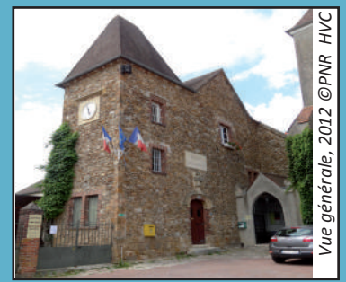
Vue générale, 2012

Architecte : inconnu Date de construction : 1880 Adresse : 1 place de la Mairie Fonction actuelle : mairie