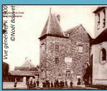
Vue générale v. 1900