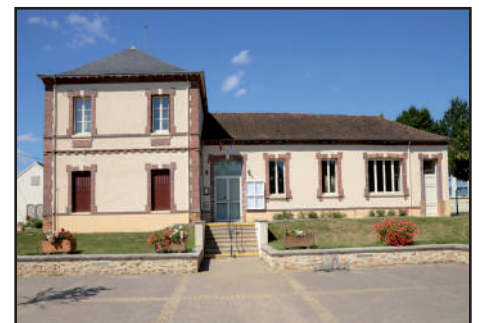
Façade sud et entrées des classes, 2016

L'ancienne mairie-école de Bullion présente un plan en T. Elle est bâtie en pierre locale de meulière recouverte d'un enduit décoré d'éléments en brique (frise, corniche, portes et fenêtres). Côté rue, trois écriteaux aujourd'hui en partie repeints rappelaient les trois fonctions du lieu : « MAIRIE », « ECOLE DE GARCONS », « ECOLE DE FILLES ». La façade de l'édifice est de composition symétrique et ternaire. Avec le porte-drapeau et les écriteaux, c'est l'une des caractéristiques discrètes qui permettent d'identifier la mairie-école. A l'intérieur, les pièces se répartissent symétriquement autour d'un vestibule central. En bas, on trouve à droite la mairie, en face le cabinet des archives, et à gauche l'accès au logement de l'instituteur où salle à manger et cuisine sont disposées de part et d'autre d'un escalier menant aux chambres à l'étage. A l'arrière, perpendiculaire au pavillon sur rue, l'école se divise en deux espaces : la classe des garçons et elle des filles. Elles sont toutes les deux accessibles par la façade sud. Les deux portes d'entrées sont encore visibles. A l'origine, l'édifice était précédé d'un espace tampon qui le séparait de la rue, fermé par un portail. De là, le perron conduisait à l'entrée principale de la mairie-école. L'actuelle entrée de la mairie s'ouvre à l'emplacement de l'ancien jardin de l'instituteur, lui aussi fermé d'un mur.