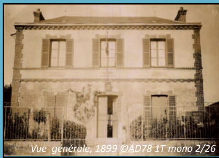
Vue générale, 1899 ©AD78 1T mono 2/26