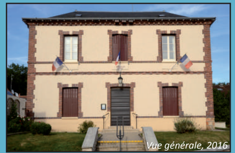
Vue générale, 2016

Architecte : Baurienne Date de construction : 1868 Adresse : 149 rue de Guette Fonction actuelle : mairie