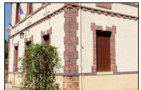
Détail du décor de brique, 2016

Aujourd'hui , l'ancienne mairie-école est restée inchangée, bien que les abords du bâtiment aient été fortement modifiés. Avec les équipements scolaires et sportifs autour de lui, l'édifice demeure un lieu central de la vie communale 150 ans après sa construction.