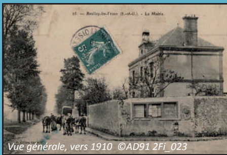
Vue générale, vers 1910