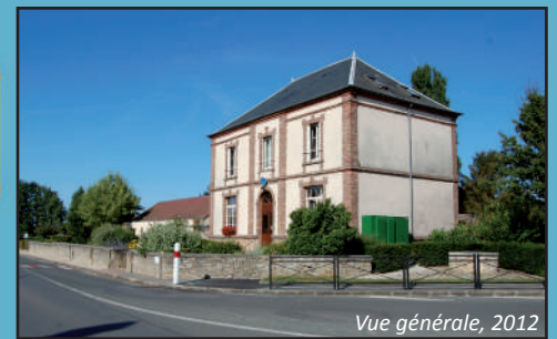
Vue générale, 2012

Architecte : Moyé Date de construction : 1871 Adresse : 2 rue du clos Saint-Jean Fonction actuelle : mairie