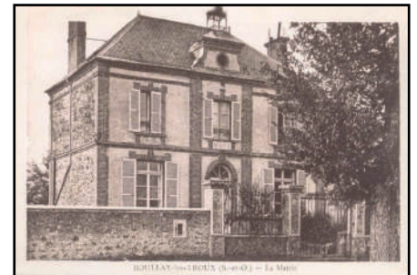
Façade, vers 1900

Aujourd'hui , le bâtiment reste inchangé à l'extérieur malgré la disparition du portail sur rue, du clocheton qui couronnait la façade et des souches de cheminée. A l'intérieur, la classe a été scindée en deux pour former le secrétariat et le bureau du maire. A l'étage, il existe encore un logement et un bureau accessible par l'ancien escalier.