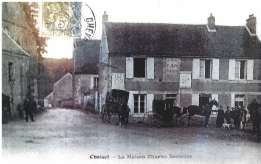
Ancienne Auberge 2 rue de la Maison forte (ancienne carte postale)

Le bâtiment se situe au cœur du bourg de Choisel au pied de l'église et à proximité de la mairie et de l'Espace Ingrid Bergman (ancienne mairie-école dédiée à la vie associative). Celui-ci a été une auberge jusqu'en 1965, date à laquelle il a été transformé en habitation.