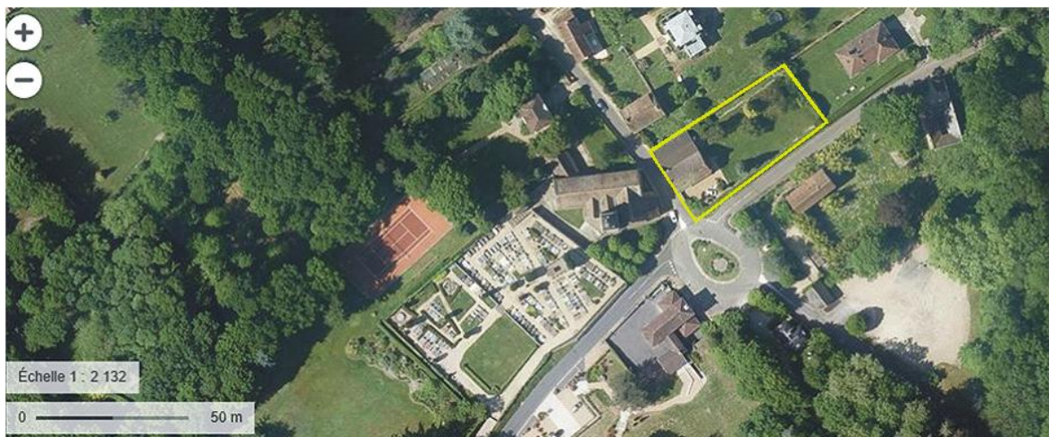
Vue satellite Géoportail de la propriété 2 rue de la Maison Forte et de son environnement proche

Une partie de la clôture du terrain entourant l'auberge sera retirée afin de lui redonner une ouverture et une visibilité à partir de la place comme cela était à l'origine