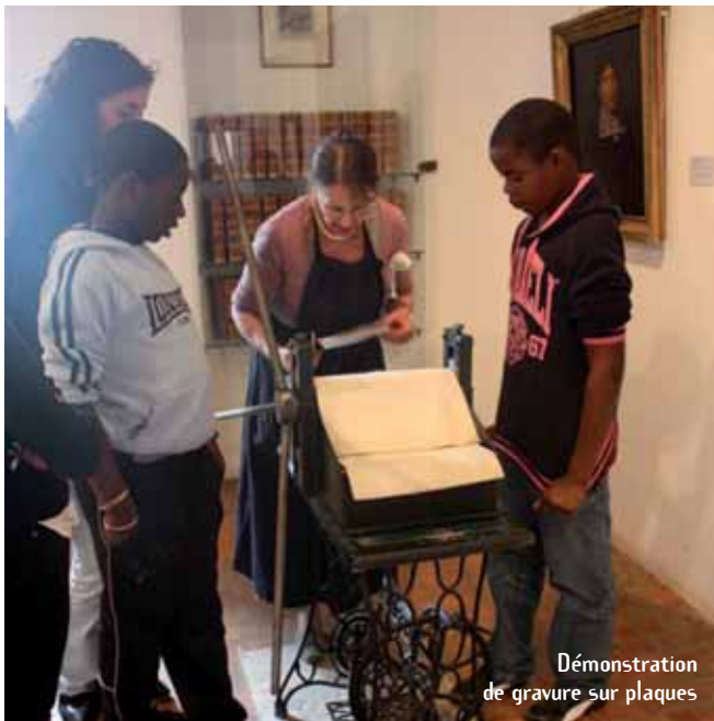
Démonstration de gravure sur plaques

et qu'il renvoie à des questions d'actualité dans la vie de chaque jeune. » Message reçu 5/5 par l'APRC.