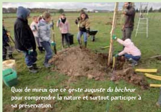
Quoi de mieux que ce geste auguste du bêcheur pour comprendre la nature et surtout participer à sa préservation.

A la saison où tout arbre prend racine, le Parc invite des enfants à planter des haies et des arbres fruitiers pour favoriser la biodiversité. Plusieurs classes et centres de loisirs se sont mobilisés en novembre dernier. Tour d'horizon de leurs réalisations : grâce au centre de loisirs de Vieille-Eglise, la Ferme Blanche verra fleurir au printemps prochain des poiriers,