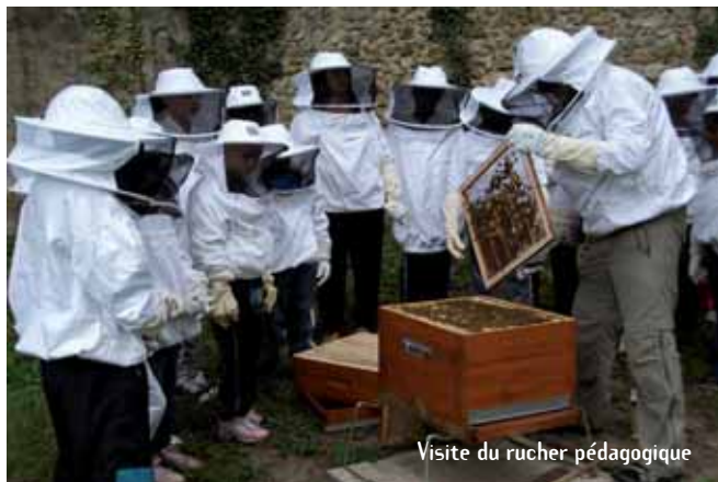
Visite du rucher pédagogique