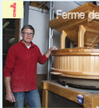
FARINE ET PAIN