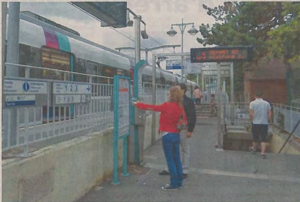
Du 12 au 18 octobre, laissez votre voiture au garage pour vos trajets quotidiens, et testez gratuitement d'autres moyens de transport. Un geste pour la planète... et votre portefeuille.

Les participants doivent impérativement habiter une des communes sélectionnées pour l'opération (Le Mesnil-Saint-Denis, Auffargis, Senlis, Bonnelles, La Queue-lez-Yvelines, Gif-sur-Yvette, Magny-les-Hameaux, Les Essarts-le-Roi, Saint-Rémy-lès-Chevreuse ou Fontenay-les-Briis, ainsi que quelques communes de Rambouillet Territoires). Les inscriptions sont ouvertes jusqu'au 20 septembre.