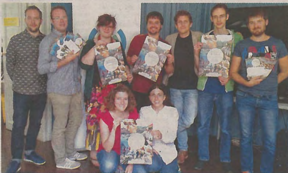
L'équipe de Wikimedia France dans ses locaux parisiens.

Des communes comme Verneuil-sur-Seine ou Orgeval