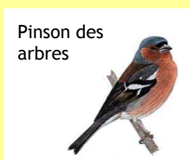
Pinson des arbres