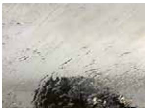
Jean-Yves Cousseau Eglise de Milon-la-Chapelle