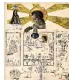
Bruno Mallard Eglise de Bullion