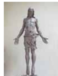
Christophe Charbonnel Eglise de Choisel