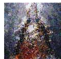
Manuel Chauveheid Eglise La Celle les Bordes