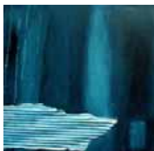
Soka Eglise de Clairefontaine