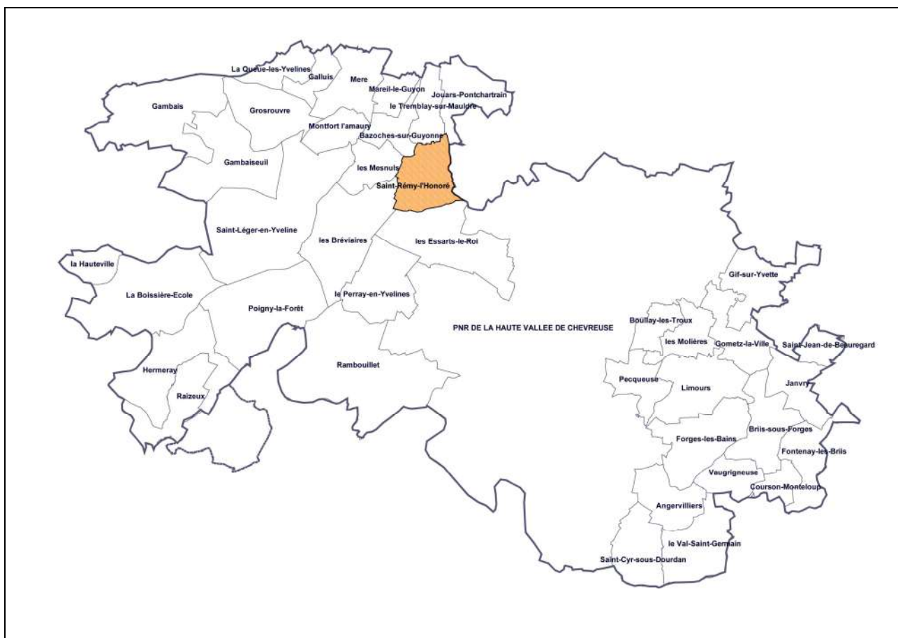
Localisation de Saint-Rémy-l'Honoré par rapport au PNR et aux autres communes favorables à leur rattachement – Kargo 2008