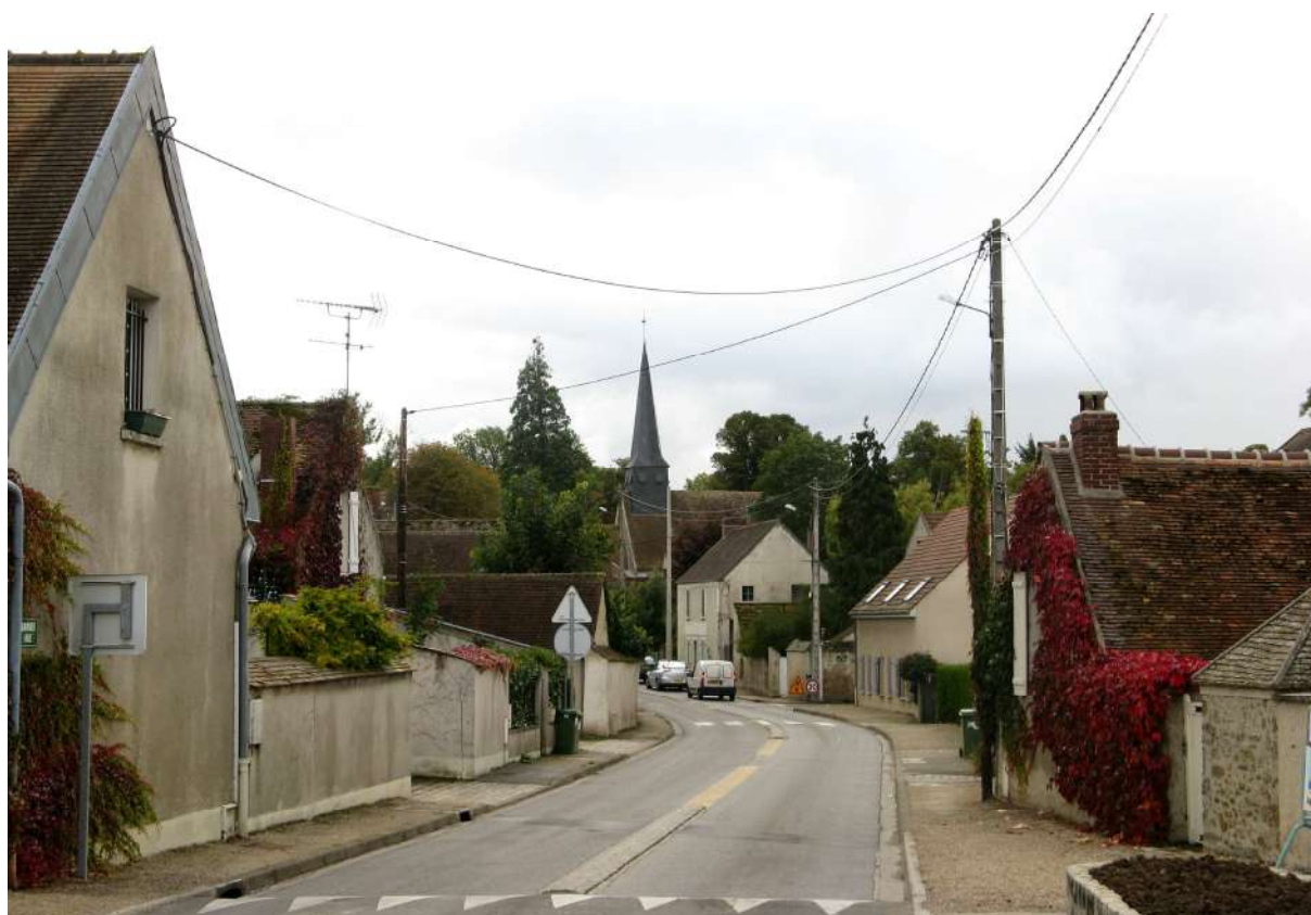
Le village de Mareil

Un autre hameau, divisé sur plusieurs communes et se trouvant à la croisée de deux routes importantes, est situé au sud de la commune : Le Cheval mort, composé de maisons rurales et de pavillons.