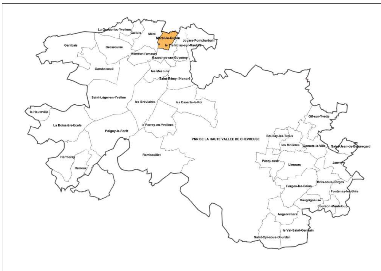
Localisation de Mareil-le-Guyon par rapport au PNR et aux autres communes favorables à leur rattachement – Kargo 2008