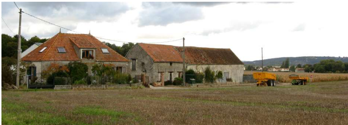
Ferme du Pavillon

avec toiture en pavillon tandis que l'autre comporte de beaux hangars et bâtiments secondaires dans un site remarquable entre champs et ruisseau ombragé.