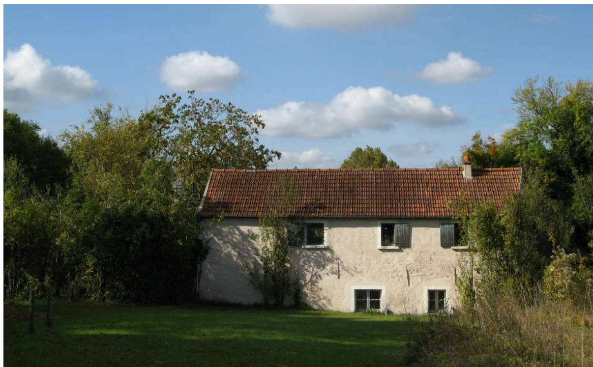
Le moulin de Lettrée

Un site intéressant, « à la croisée des chemins ». Les constructions récentes sont présentes dans le hameau du Bout-de-l'Eau qui comporte un important lotissement pavillonnaire s'étendant sur le plateau. Le village compte quelques maisons de bourg très rénovées ou neuves, ainsi que quelques pavillons à son extrémité nord.