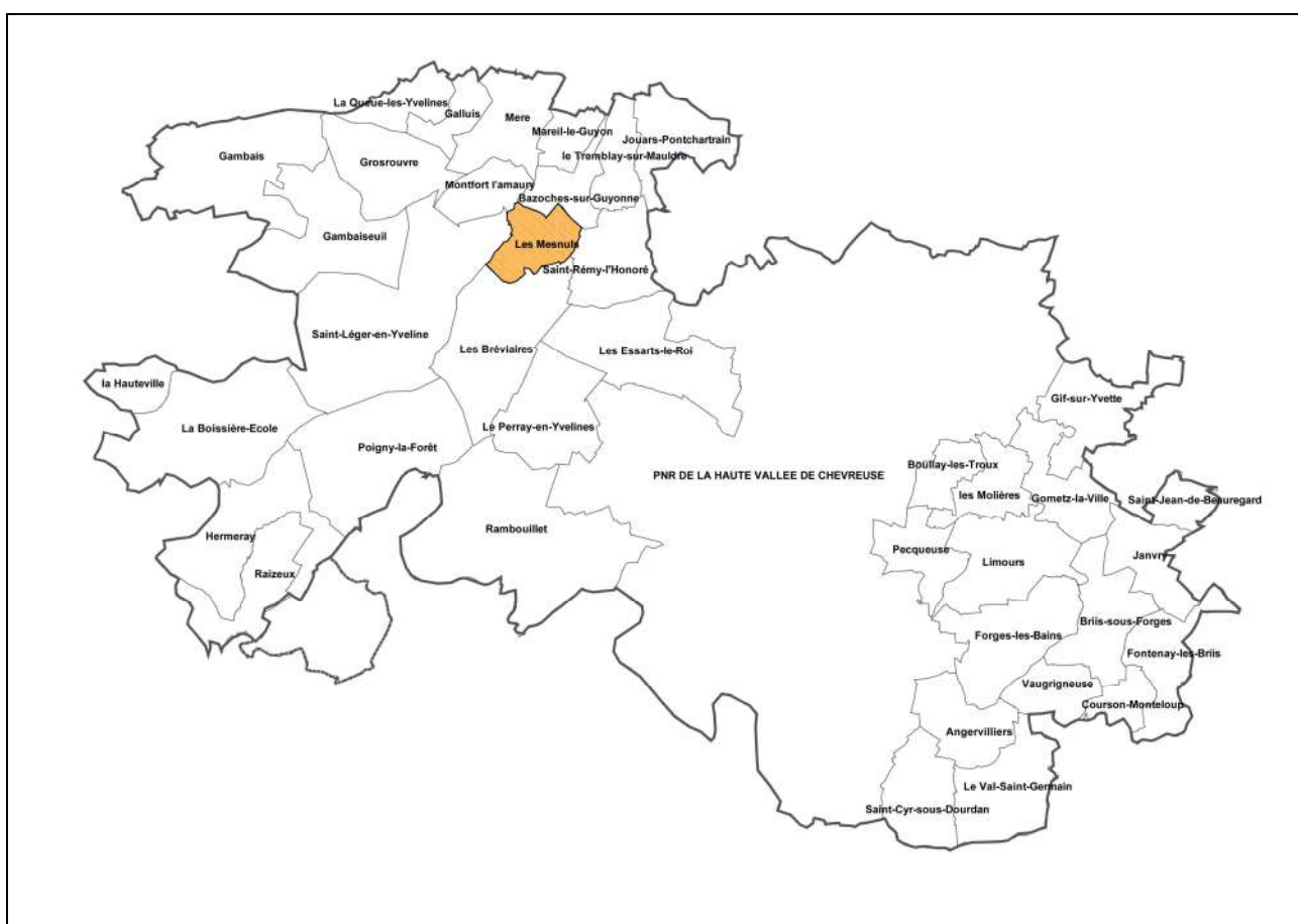
Localisation des Mesnuls par rapport au PNR et aux autres communes favorables à leur rattachement – Kargo 2008