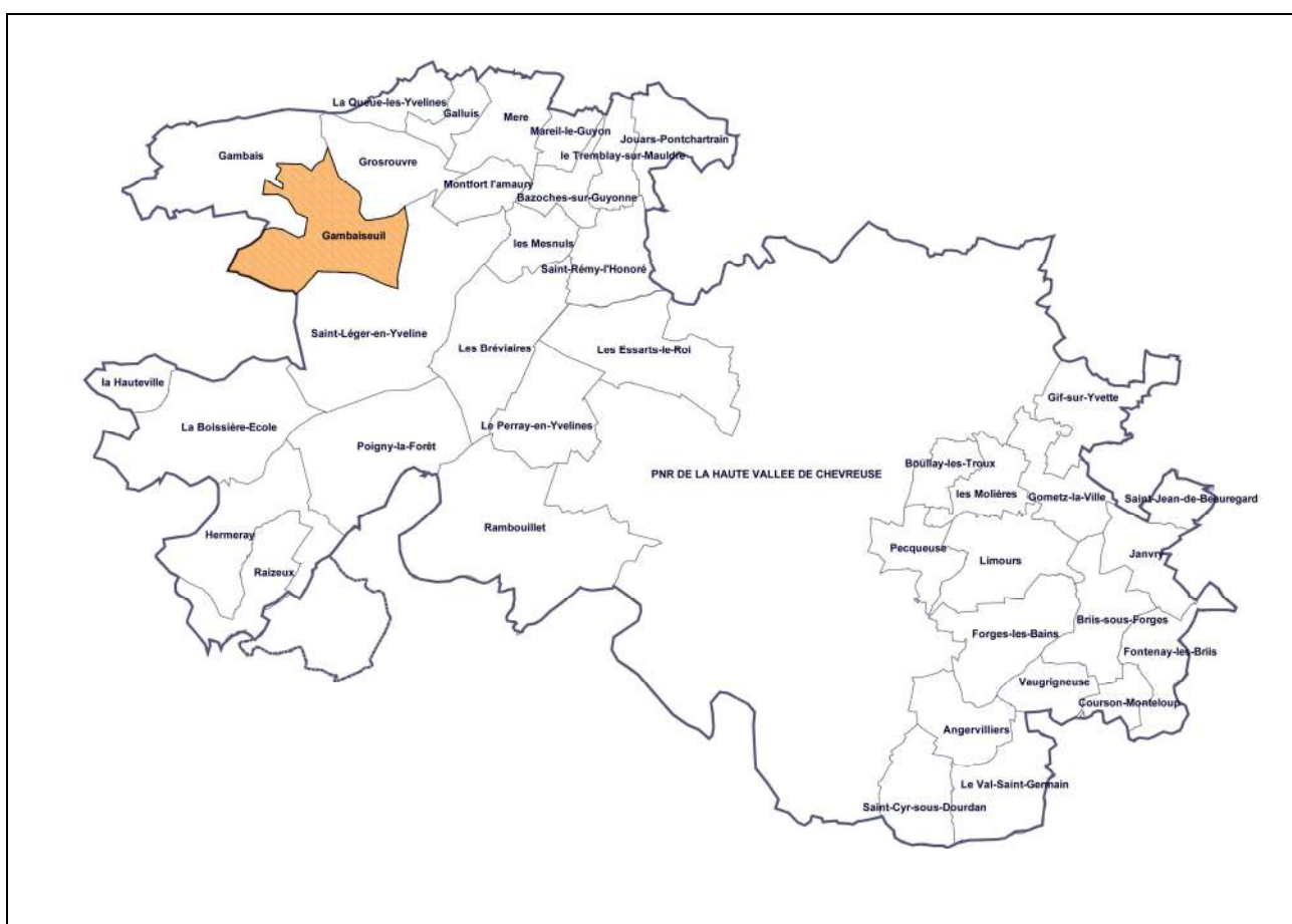
Localisation de Gambaiseuil par rapport au PNR et aux autres communes favorables à leur rattachement – Kargo 2008